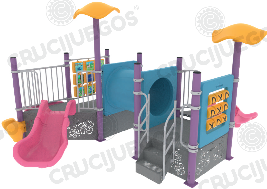
Imagen referencial. Para más información ingrese a www.insumos.crucijuegos.com